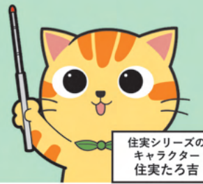
住実シリーズの キャラクター 住実たる吉